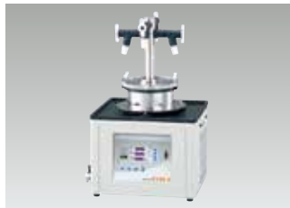
Flask용 매니폴드 세트