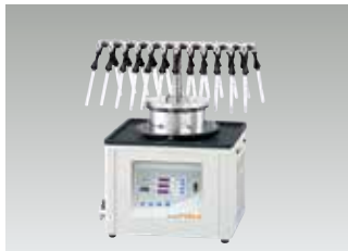
시험관·앰플병용 매니폴드 세트