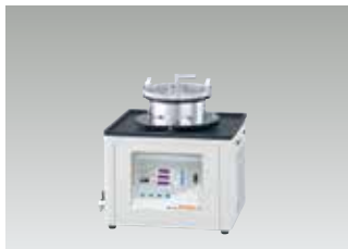
노즐부착 커버 세트